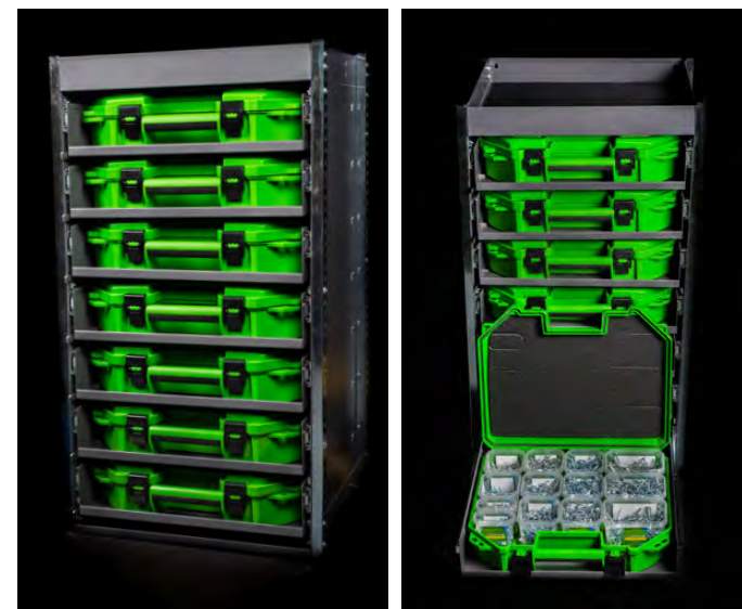
Bilderna visar bilrack för ESSBOX Mini.

Mått (mm): B520, H900, D595 Art nr. 6529997