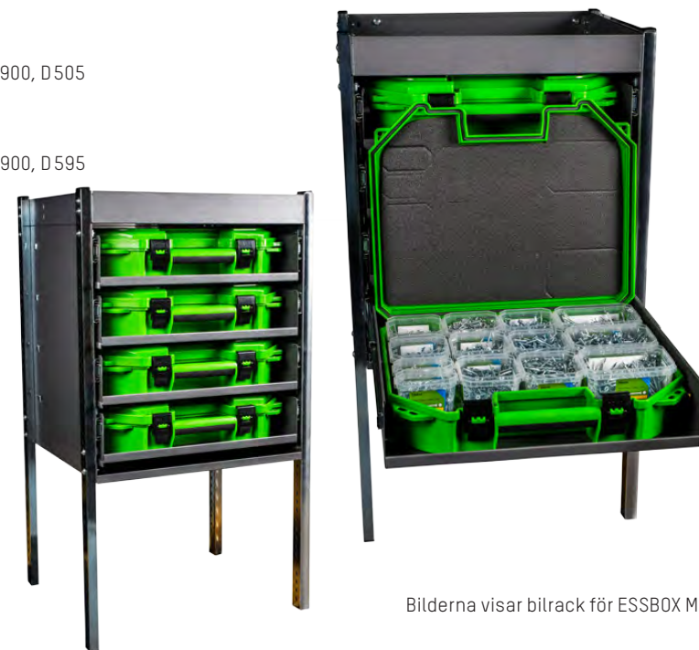
Bilderna visar bilrack för ESSBOX Mini.

Mått (mm): B520, H900, D595 Art nr. 6529994