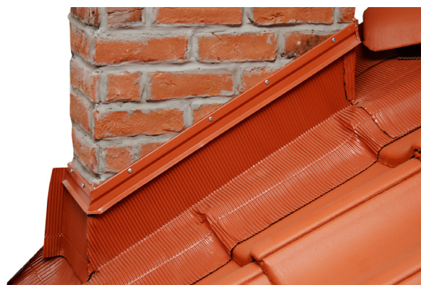
Montering av skorstenstätning